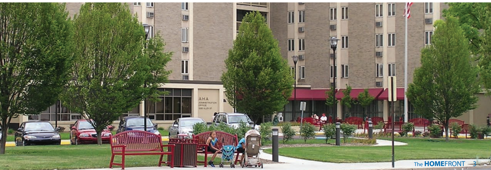
Below: Plaza renovations outside Gross Towers have been completed and the area now attracts residents who enjoy sitting outdoors in the nice summer weather.