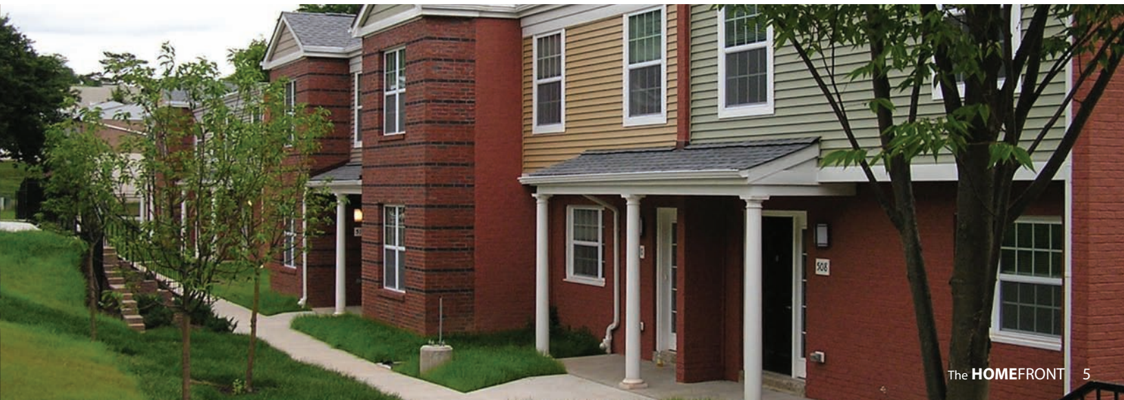
Below: Fourteen apartments in Cumberland Gardens have been completely refurbished with new exteriors, major interior renovations and landscaping aimed at bringing the homes up to 21st Century standards.

The permanent 10 by 40 foot mural will be dedicated later this summer.