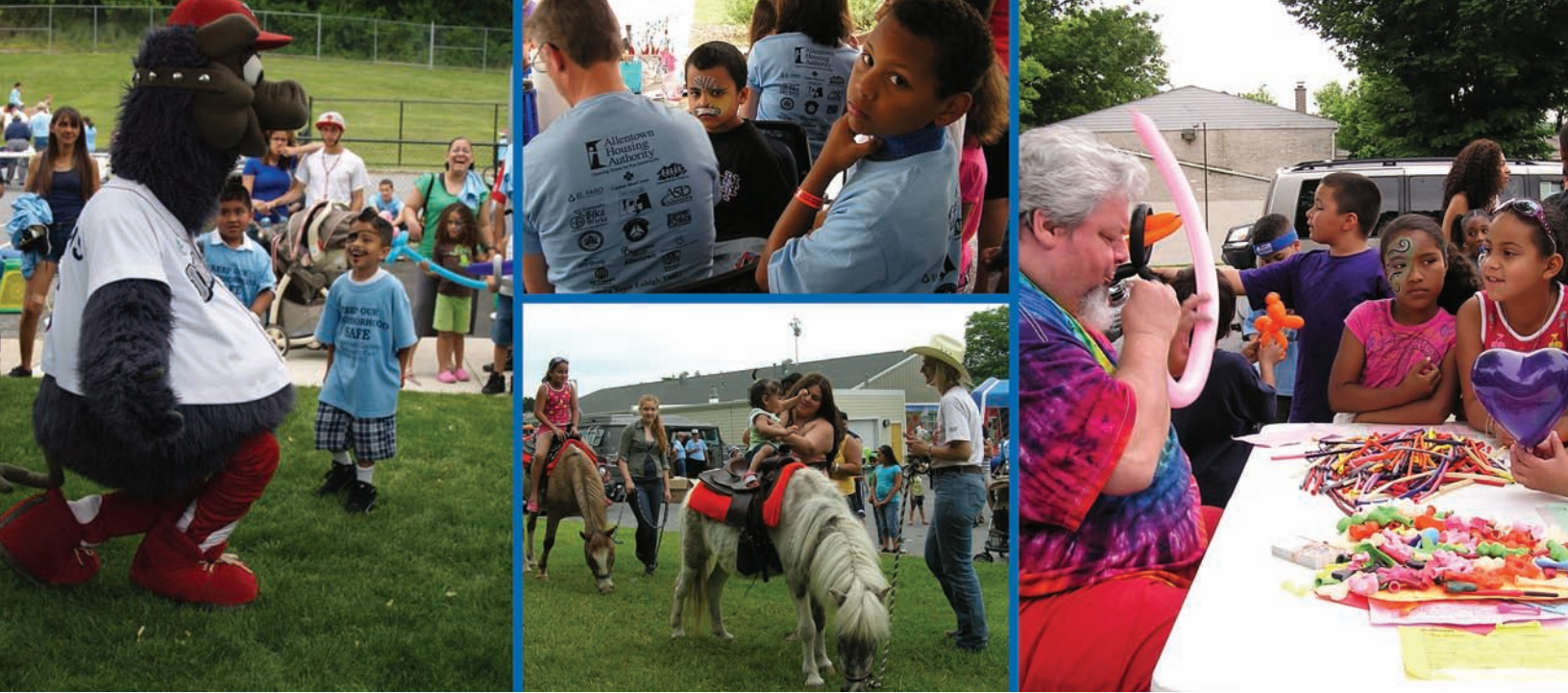
Above: Ferrous, el mascota del popular equipo de pelota de AAA los IronPigs, disfruta durante el Día de la comunidad de Cumberland Garden. Mientras tanto, los jóvenes disfrutan de pintura de caras, carreras en caballitos y animales de globos durante el día de feria que además ofreció acceso a una variedad de organizaciones de servicio.