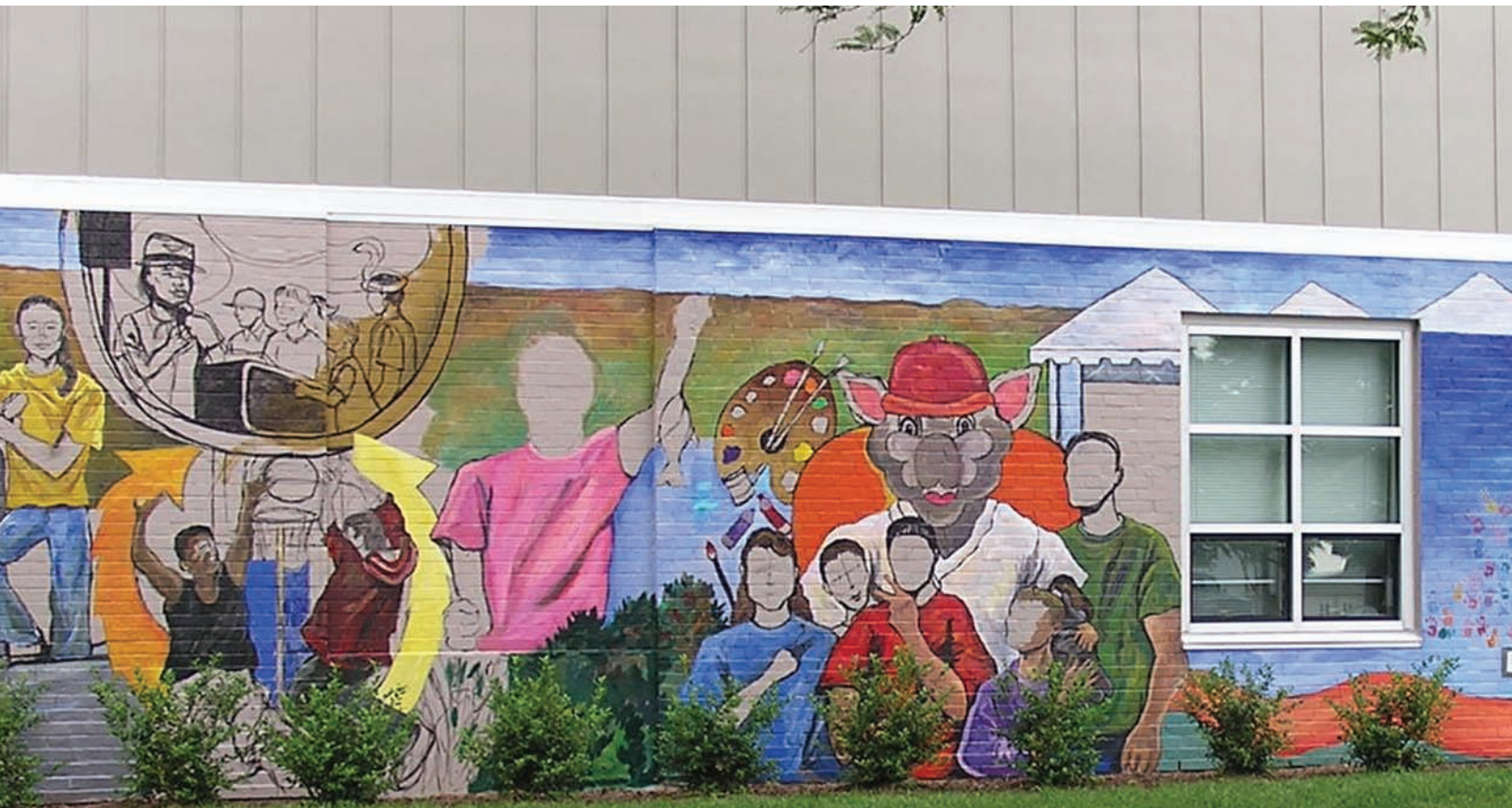
Below: The mural on the wall of the newly renovated Cumberland Gardens Community Center.