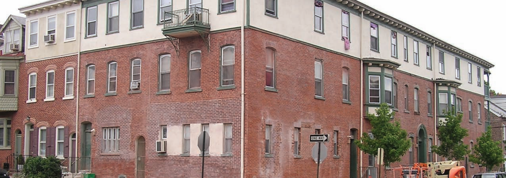
Above: Working with a façade grant from the City of Allentown, the Allentown Housing Authority undertook a major exterior renovation of this apartment building at 9th and Gordon streets in the Old Allentown Preservation District.