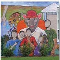
pages 5, 10