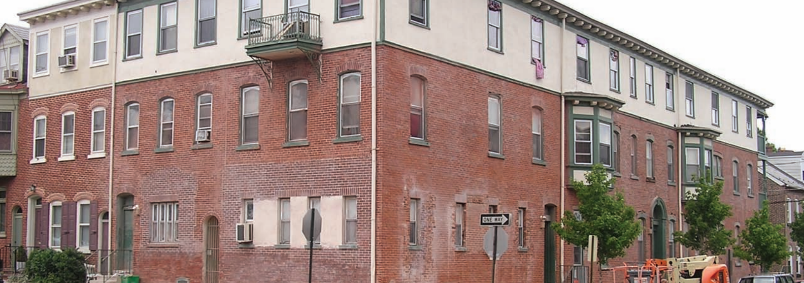
Above: Trabajando con una subvención para fachada de la Ciudad de Allentown, la Autoridad de Vivienda de Allentown emprendió una renovación mayor del exterior de éste edificio de apartamentos en las calles 9na y Gordon en el Viejo Distrito de Preservación de Allentown.