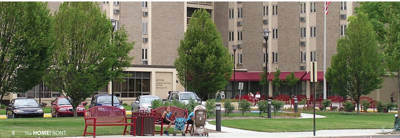
Below: Renovaciones a la plaza afuera de Gross Towers han sido completadas y ahora el área atrae residentes que disfrutan sentándose afuera en el buen tiempo de verano.

El trabajo exterior incluye nuevos canales de desagüe y drenaje. El edificio incluye un total de más de 100 apartamentos.