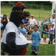
pages 4, 9