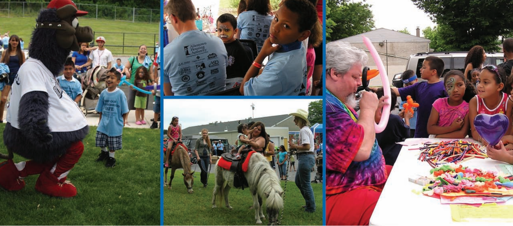
Above: Ferrous, the mascot for the popular IronPigs AAA baseball team, hams it up at Cumberland Gardens Community Day. Meanwhile, youngsters enjoy face-painting, pony rides and balloon animals during the day-long fair that also offered access to a variety of service organizations.